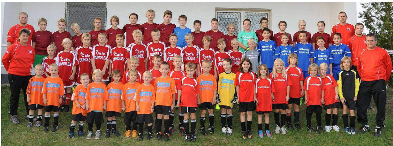
Unsere Nachwuchsspielerinnen und -spieler mit ihren Trainern

Auskunft erhalten Sie bei Sonja Schreder (0676-4062777)