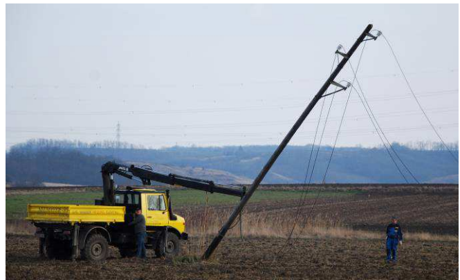
Entfernen der Strommasten im Bereich Franz Ecker Siedlung

Die 20 kV (20.000 Volt) Leitung zwischen dem ehemaligen Umspannwerk Jetzelsdorf und Pernersdorf wurde demontiert.